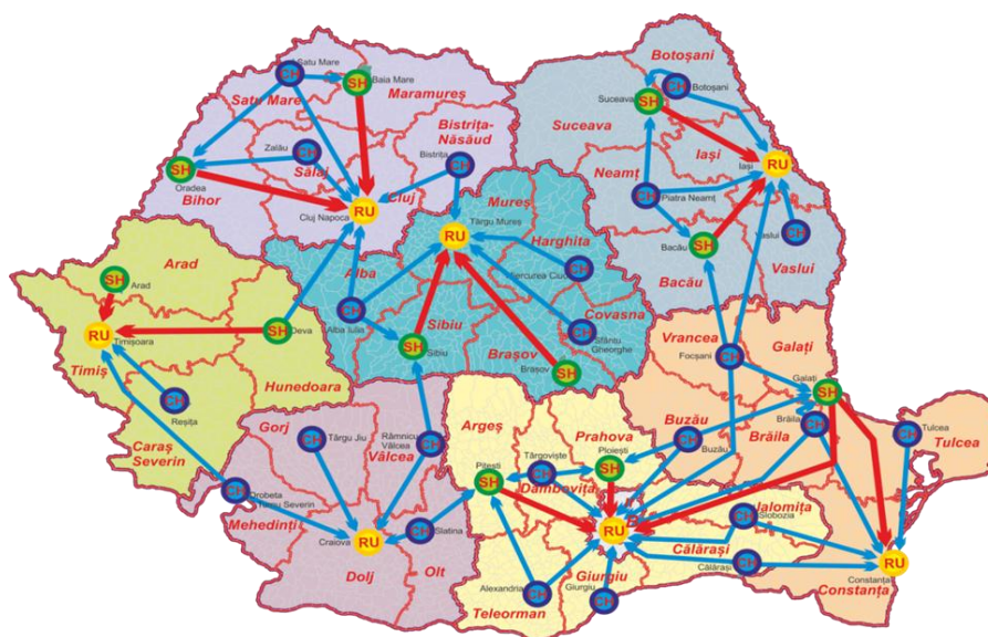
Fig. 3. Viziunea asupra rețelei regionale de servicii spitalicești

Reforma asistenței medicale cu paturi trebuie să prevadă reevaluarea spitalelor, raționalizarea lor precum și revizuirea criteriilor de clasificare a spitalelor, implementarea acestora și respectiv reorganizarea spitalelor pe niveluri de competență care să includă criteriile pentru îngrijirea integrată a pacientului critic și a cazurilor complexe, cu spitale regionale cu înalt nivel de performanță - cu personal, infrastructură și finanțare adecvate. Se impune înlocuirea ofertei de servicii spitalicești neperformante cu servicii alternative (spitalizare de zi și în ambulator) care să ofere continuum-ul de servicii necesar, precum și consolidarea îngrijirilor pe termen lung cost-eficace (ex. îngrijiri la domiciliu) pe cât se poate la nivel de comunitate.